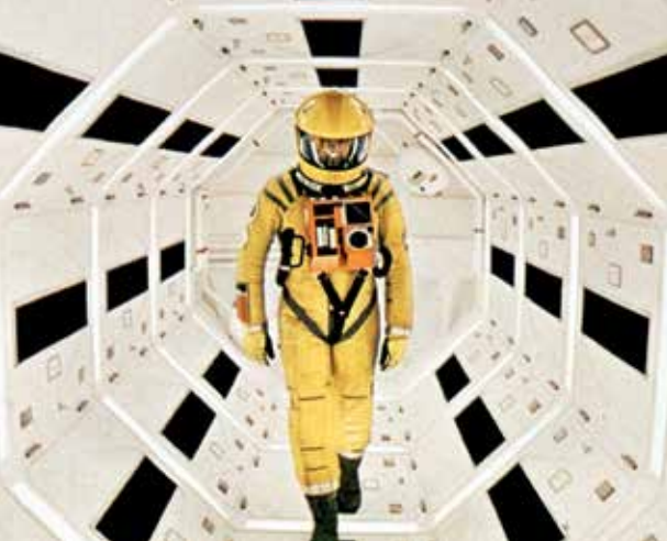
MI 20.2. 18:00 Türoffnung im ewz-Unterwerk Selnau 20:00 Filmbeginn