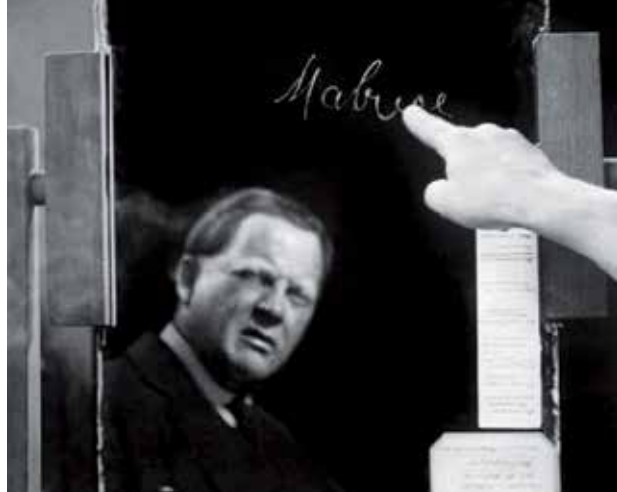
DO 21.2. 18:00 Türoffnung im ewz-Unterwerk Selnau 20:00 Filmbeginn